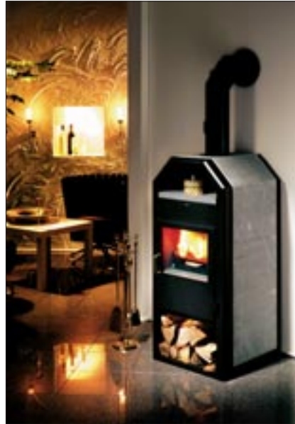
Kaminofen GS 8 RLU in schwarz mit Speckstein