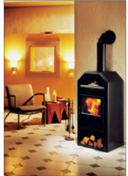
Kaminofen GD 8 RLU in schwarz mit schwarzer Farbverkleidung

Die Modelle sind mit verschiedenen Farbverkleidungen, Speckstein, australischem Sandstein, Edelstahl und 6 Keramikfarben erhältlich.