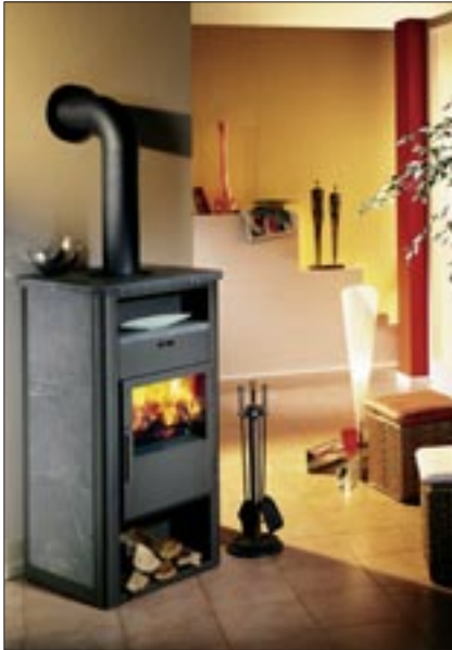
Kaminofen GD 8 RLU/S in gussgrau mit Speckstein und rundem Rauchrohr-Set (Mehrpreis)