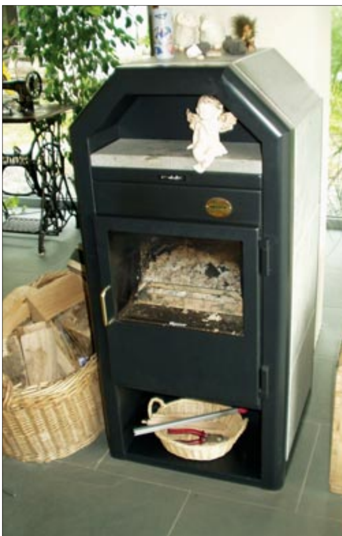
Ein Scheitholzofen im Wohnraum ermöglicht Heizwärme zum Nulltarif, wenn Brennholz zur Verfügung steht.